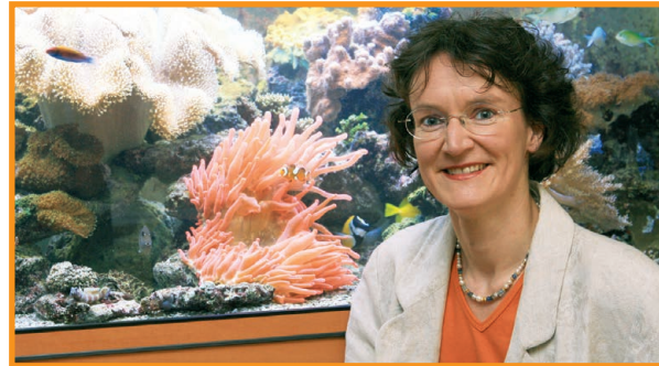
Dr. Johanna B. Wesnigk Environmental & Marine Project Management Agency

EMPA zeigt, dass erfolgreiche EU-Forschungsprojekte sowohl interessant und spannend sind, als auch hochwertige wissenschaftliche Ergebnisse liefern.